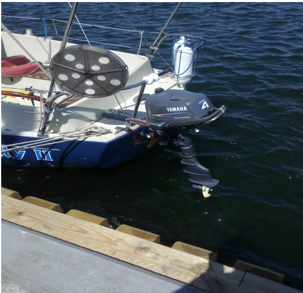
Zdjęcie nr 2. Widok na zamocowany na rufie jachtu silnik zaburtowy

W dniu 5 lipca 2013 r. Holly II wznowił podróż. Około godz. 13:00 załoga odcumowała od nabrzeża przystani klubu Neptun z zamiarem dopłynięcia do portu w Helu. Podróż z Górek Zachodnich rozpoczęto na żaglach. Po pewnym czasie ze względu na niekorzystne do żeglowania warunki wiatrowe (bardzo słaby wiatr) kapitan jachtu zrzucił żagle i uruchomił najpierw silnik zaburtowy, a następnie silnik główny.